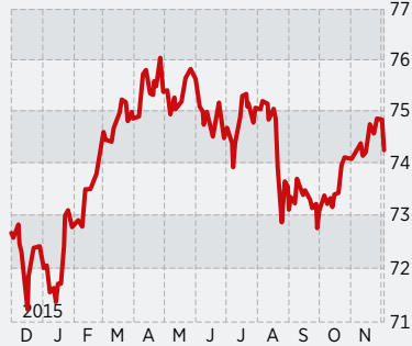
First Private Wealth in €

Im Unterschied zu mehreren großen, namhaften Mischfonds hielt sich der First Private Wealth auch in diesem schwierigen Aktien- und Anleihenjahr bisher im Plus .