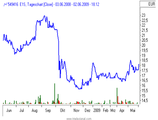
~ 549416 E1S, Tageschart [Close] - 03.06.2008 - 02.06.2009 - 18.12

* Quelle DeutscheBörse (Frankfurt Parkett und Xetra, 100 Tage)