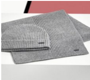
Hugo Boss-Aktie // Gut war nicht gut genug