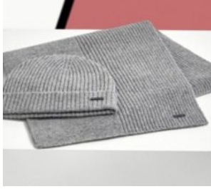
Hugo Boss-Aktie // Gut war nicht gut genug