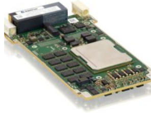
Kontron-Aktie // Katek einverleibt und Delisting geplant