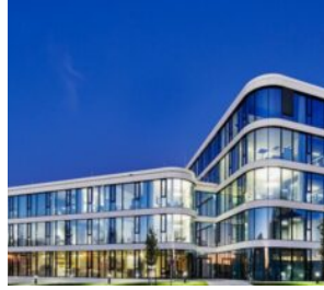
All for One-Aktie // Der Boden für weitere Kursgewinne ist bereitet