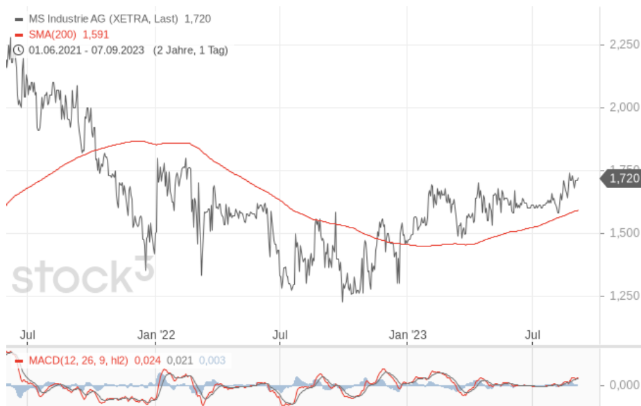
Bildquelle: MS Industrie; Chartquelle: stock3.com