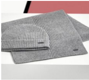
Hugo Boss-Aktie // Gut war nicht gut genug